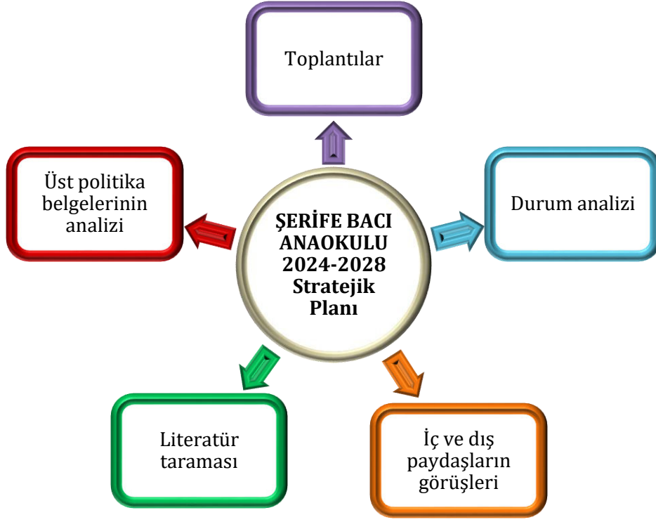
Şekil 1: Stratejik Plan Oluşum Şeması

2024-2028 Stratejik Plan çalışmaları müdürlüğümüzce personele duyurulmuştur. Birimlerin çalışmalara azami katılım ve desteklerinin, açıklama yazısı ve ekler doğrultusundaki dokümanlardan faydalanılarak yapılması sağlanmıştır.